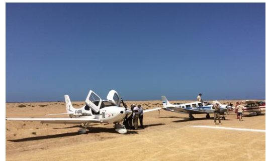
Vue des équipages dans le désert

Sur près de 10 000 kilomètres et durant deux semaines, ce rallye aérien entre Toulouse et Saint-Louis au Sénégal, en passant par le sud de l'Espagne, le Maroc et la Mauritanie, propose de suivre les traces des pionniers de l'Aéropostale , alliant un magnifique voyage aérien sur les traces des pionniers de l'aviation, une évocation historique et une compétition intéressante et ludique à l'origine d'une émulation motivante.